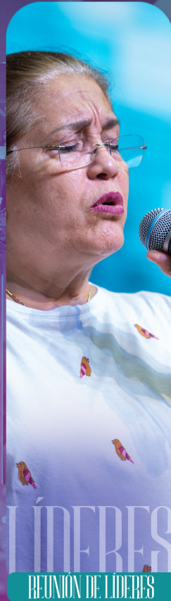
REUNIÓN DE LÍDERES