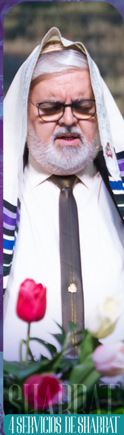
4 SERVICIOS DE SHABBAT