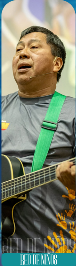
RED DE NIÑOS