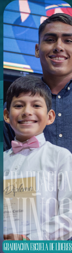
GRADUACIÓN ESCUELA DE LÍDERES