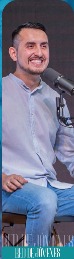
RED DE JÓVENES